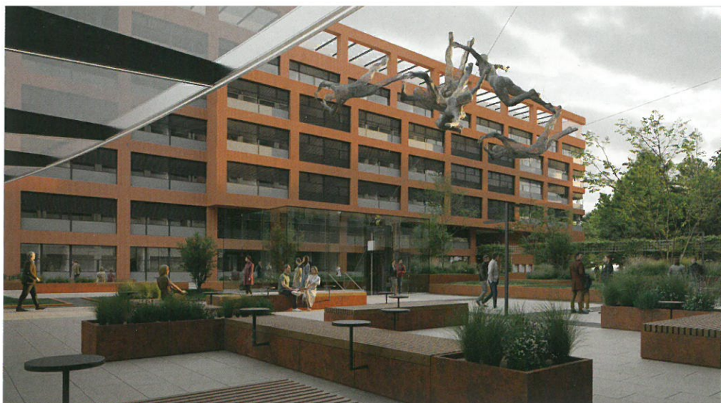
▲ Obr. 15 Parkové úpravy kolem budovy budou využívat vysoké traviny v kombinaci s keřovým podrostem, vizualizace

Skladba střechy je navržena s tepelnou izolací z polystyrenu s U_{stř} = 0,11 (W/m 2 K). Systém zelené střechy navíc umožňuje nejen akumulaci srážkové vody, ale zlepšuje i tepelnou pohodu. Okraje střechy jsou navrženy s ohledem na celkovou proporci fasád se skrytou (minimalizovanou) atikou a obvodovým pásem z praného říčního kameniva zajišťujícího minimální výškový rozdíl mezi úrovní střechy a hlavou atiky. Případné zábrany proti pádu osob budou realizovány v dostatečném odstupu od fasády, aby se neprojevovaly v pohledu z ulice, dalším prvkem bude i závěsný systém pro mytí oken z vnější fasády. Součástí střešní krajiny jsou technologické celky (výparníky tepelného hospodářství).