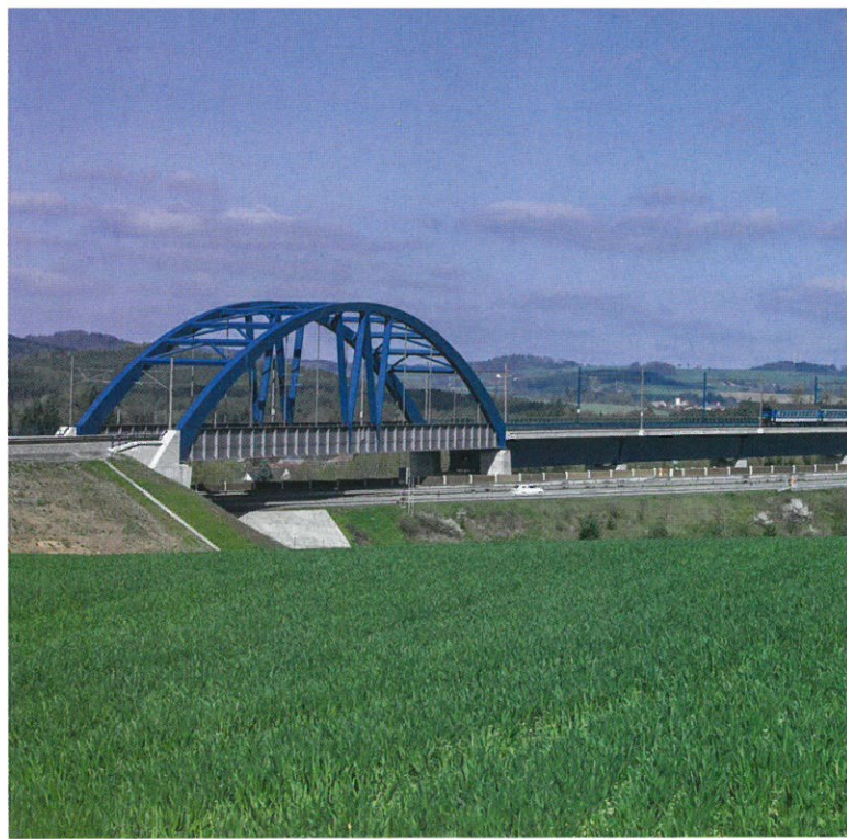
▲ Stavba roku 2016: Modernizace trati Tábor – Sudoměřice; projektant: SUDOP PRAHA a.s.; investor: Správa železniční dopravní cesty, státní organizace; dodavatel a přihlašovatel: OHL ŽS, a.s.

jak v tvarování stavby, tak v pojetí jednotlivých povrchů je dovedeno na maximum ve své působivosti. Těch šest staveb je tak rozličných, jak jen mohou být. Přitom se mezi ně nevešla žádná ze sta-