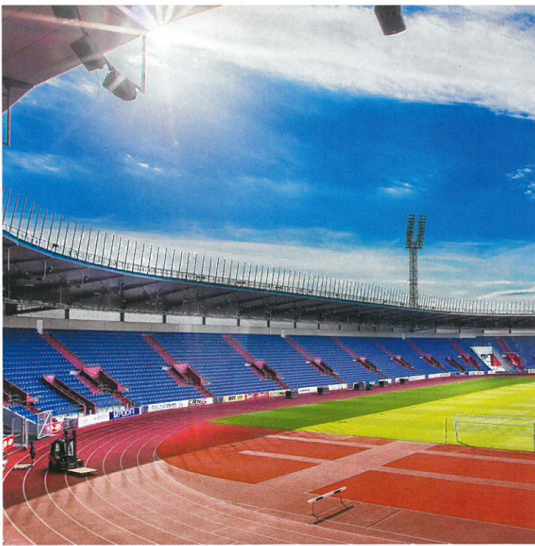
▲ Stavba roku 2016: Rekonstrukce městského stadionu v Ostravě; projektant: HUTNÍ PROJEKT OSTRAVA a.s.; investor a přihlašovatel: statutární město Ostrava, VÍTKOVICE ARÉNA; dodavatel: Metrostav a.s., HOCHTIEF CZ a.s.